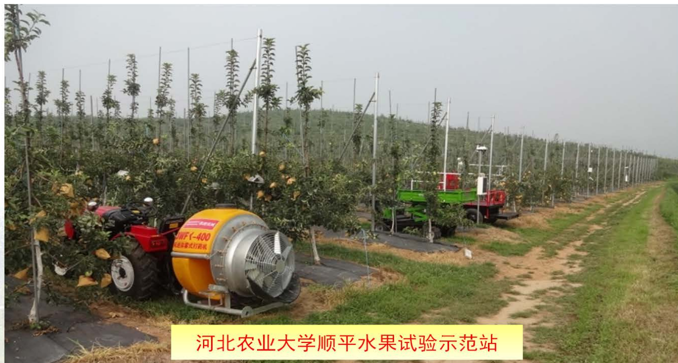
河北农业大学顺平水果试验示范站