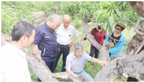
管氏肿腿蜂防治红颈天牛技术示范