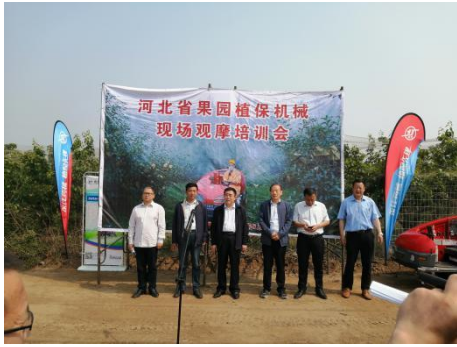
观摩培训会介绍情况